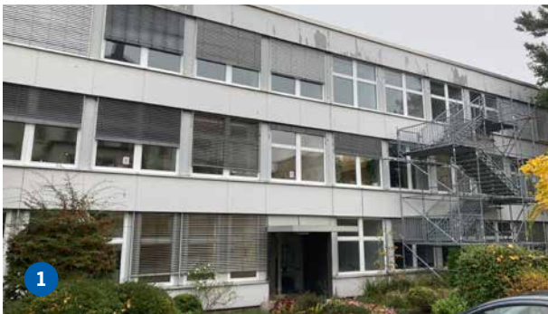
Bild 3: Westfalenhaus