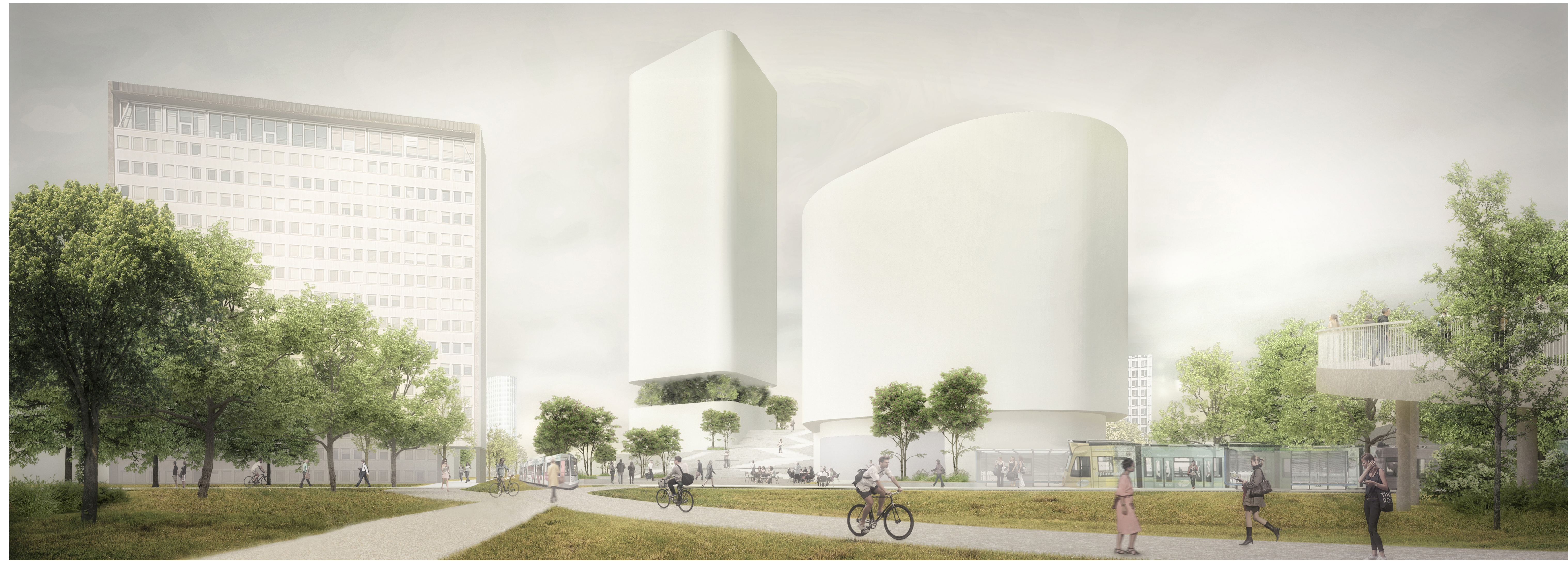
Visualisierung - Blick aus Richtung Rheinkniebrücke