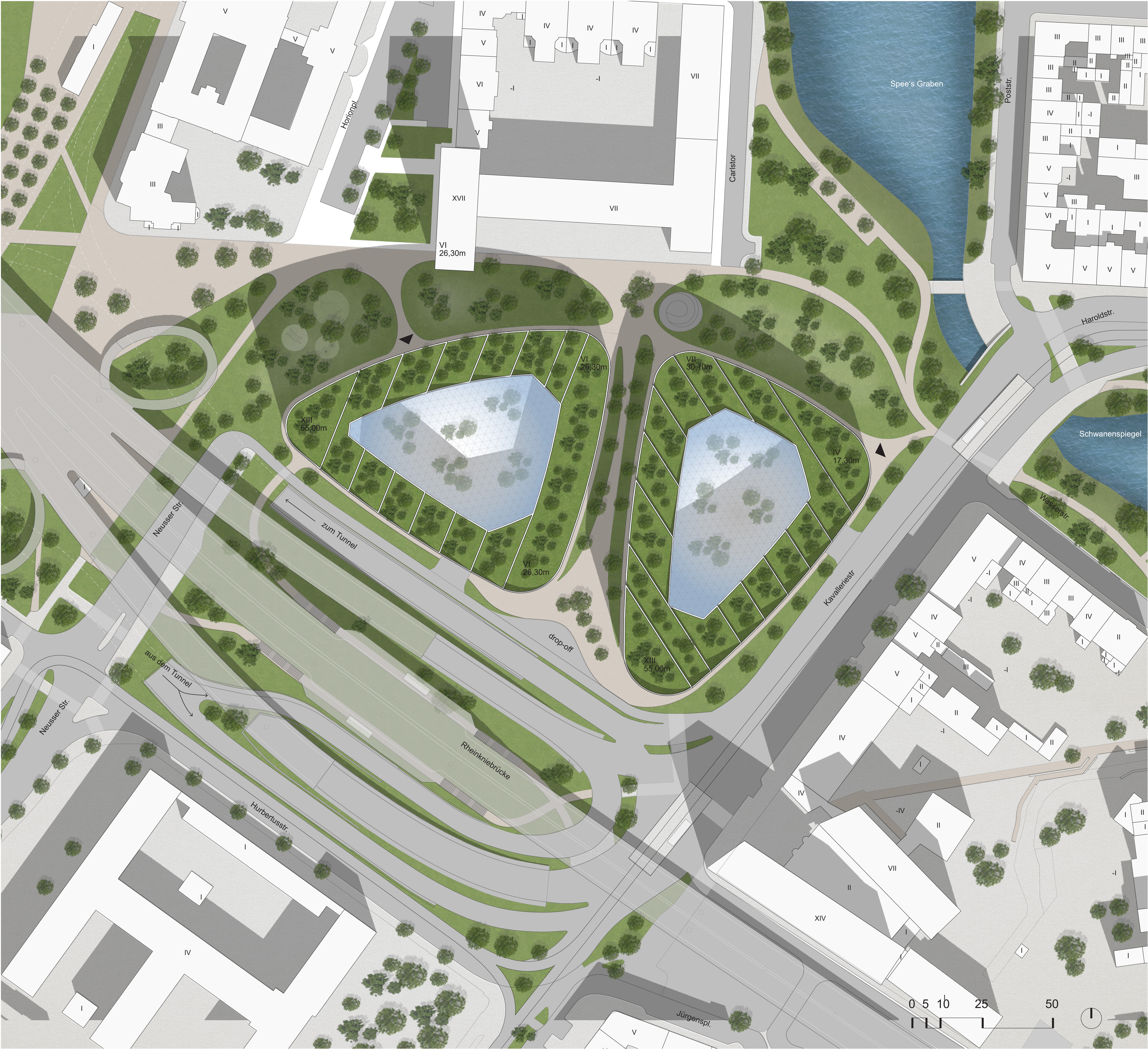
Städtebauliches Konzept zur Einbindung des Standortes, M 1:500