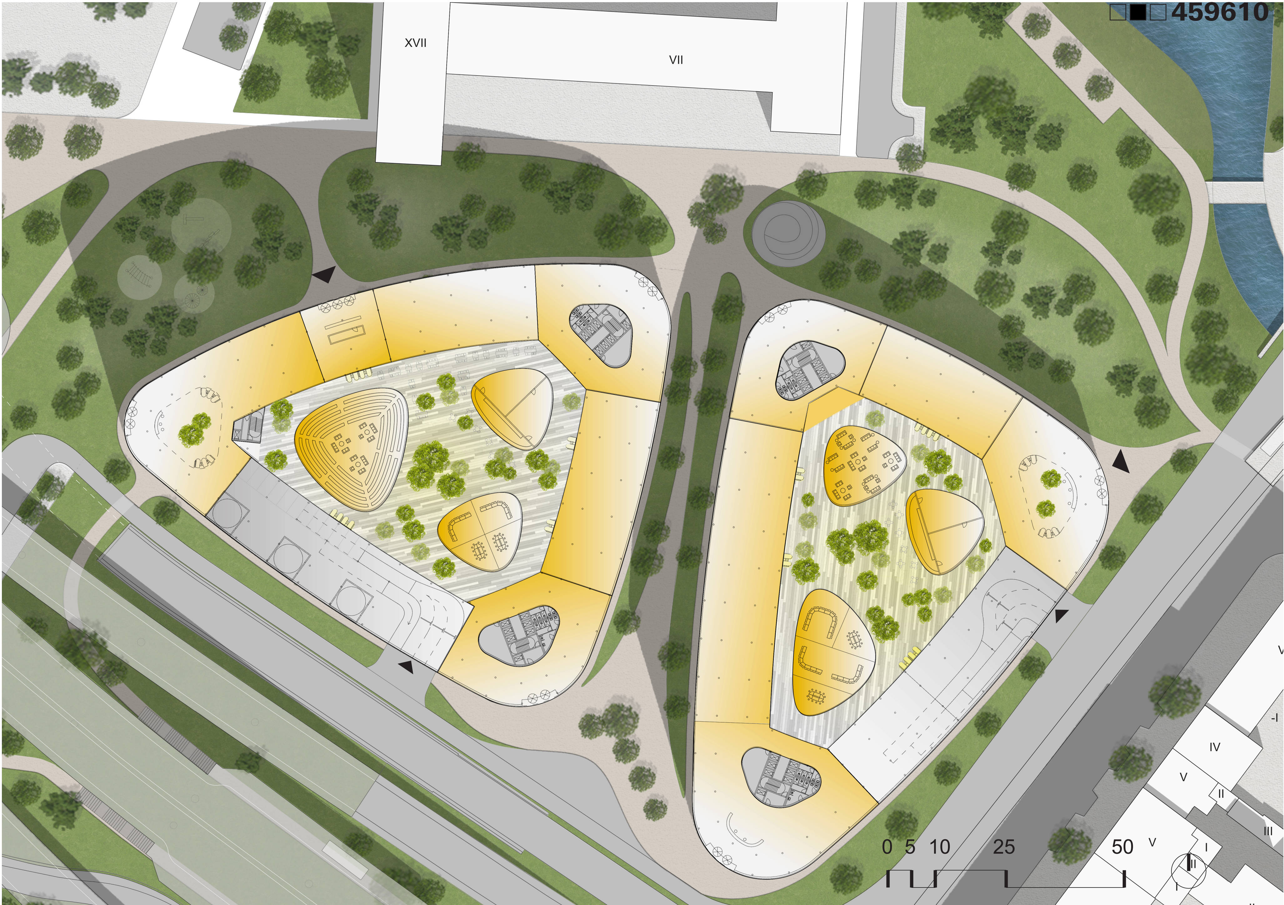
Erdgeschoss, M 1:500