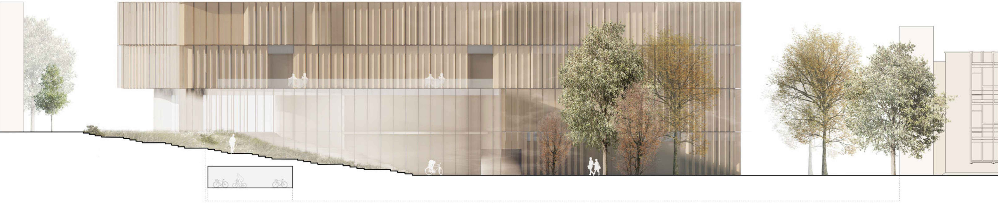
Ansicht Ost M 1:200