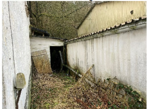
Bild 4: Nördliche Grundstücksgrenze, Anbau Schuppen und eingeschossiger Anbau auf dem Nachbarflurstück